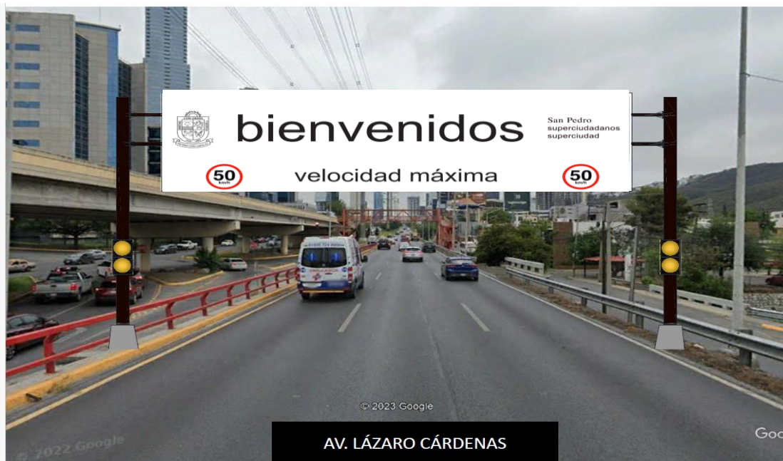
Ilustración de referencia 1.4