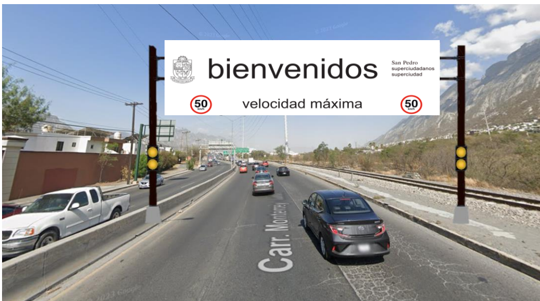
Ilustración de referencia 1.2