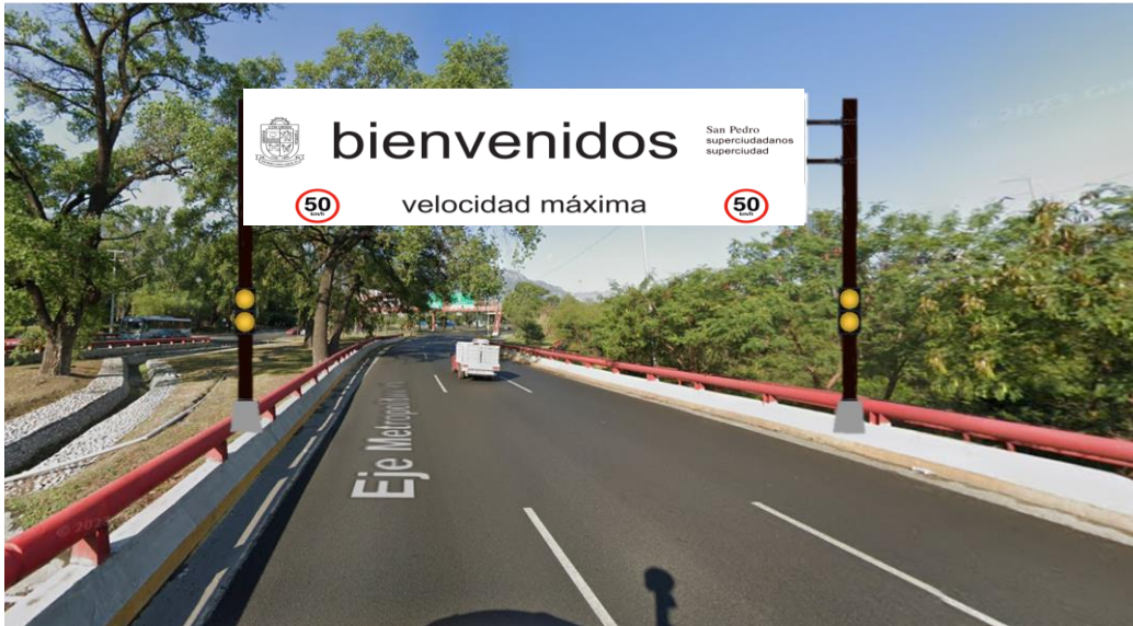
Ilustración de referencia 1.1