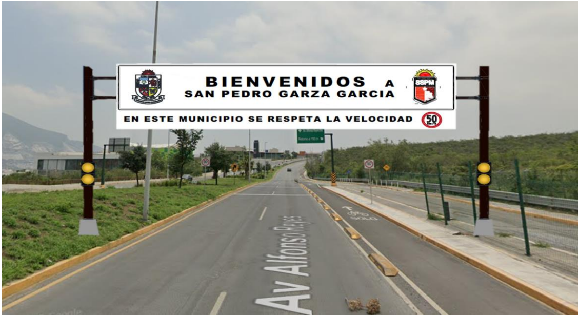
Ilustración de referencia 1.7

NOTA: Las imágenes pueden variar y se proporcionará el diseño final al que resulte favorecido en esta licitación.