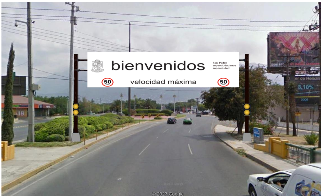
Ilustración de referencia 1.6