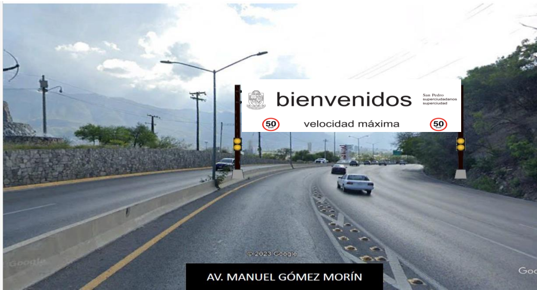
Ilustración de referencia 1.3