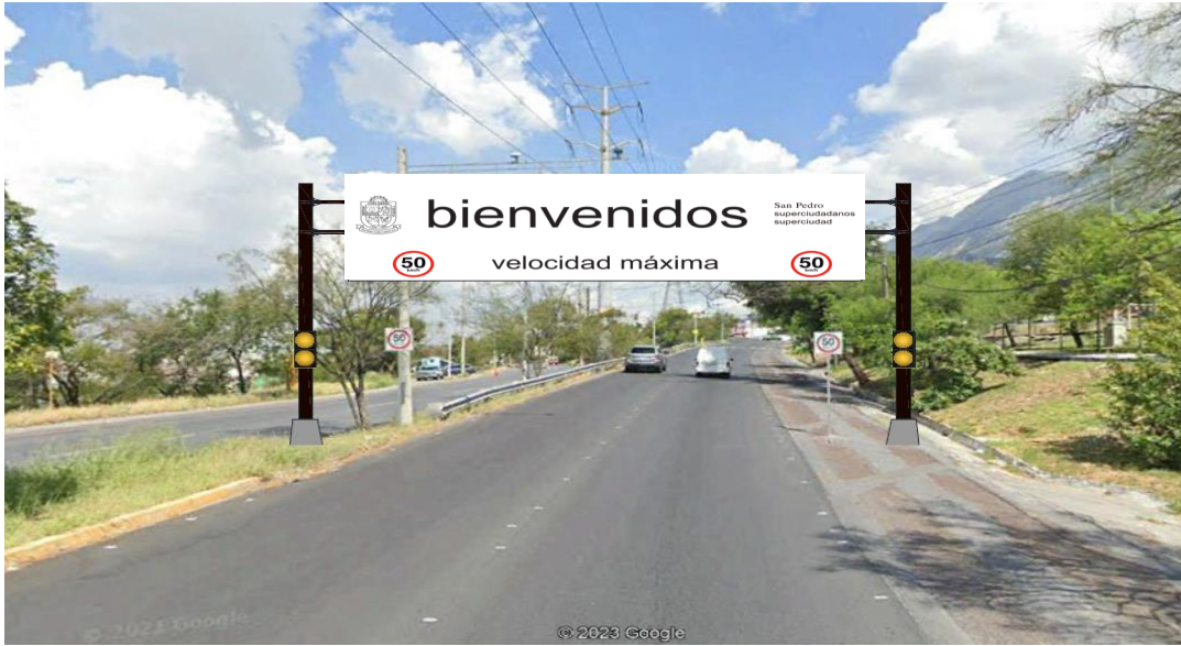
Ilustración de referencia 1.5