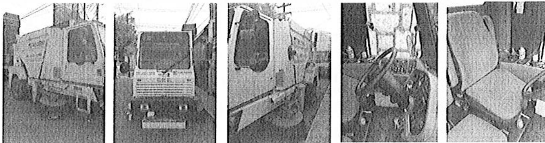
Fotografías del recolector de basura por succión