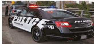
- RESISTENCIA DE CABINA A PRUEBAS DE IMPACTO TRASERAS A 120KM/HR