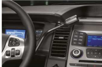
- PALANCA DE VELOCIDADES EN EL TABLERO

All Wheel Drive (AWD) Frenos de disco de 13.9" de alto desempeño Callipers frontales y traseros de trabajo duro Electric Power-Assist Steering (EPAS) Transmisión automática de 6 velocidades reforzada Alternador de 220 Amp, ideal para conversiones Batería de 78A/750 CCA, ideal para conversiones 2 Entradas de 12VCD Sistema de enfriamiento de servicio pesado Medidor de horas de motor Escape doble Tanque de gasolina de 71L Suspension frontal independiente McPherson con barra estabilizadora. Radio de giro de 3.16