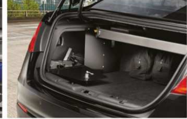
- ESPACIOSA Y PRÁCTICA CAJUELA