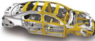
- CARROCERÍA CON ZONAS DE ABSORCIÓN DE IMPACTOS

Vidrios polarizados Faros de halógeno Espejos laterales eléctricos Llantas 245/55R18 A/S BSW Rin de acero 18" x 8" con tapón de plástico negro Llanta de repuesto de tamaño normal 18" 245/55 Sistema sin tapon de gasolina Easy Fuel®